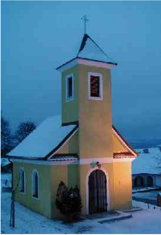
Die Kapelle am Abend des Dreikönigstages 2003