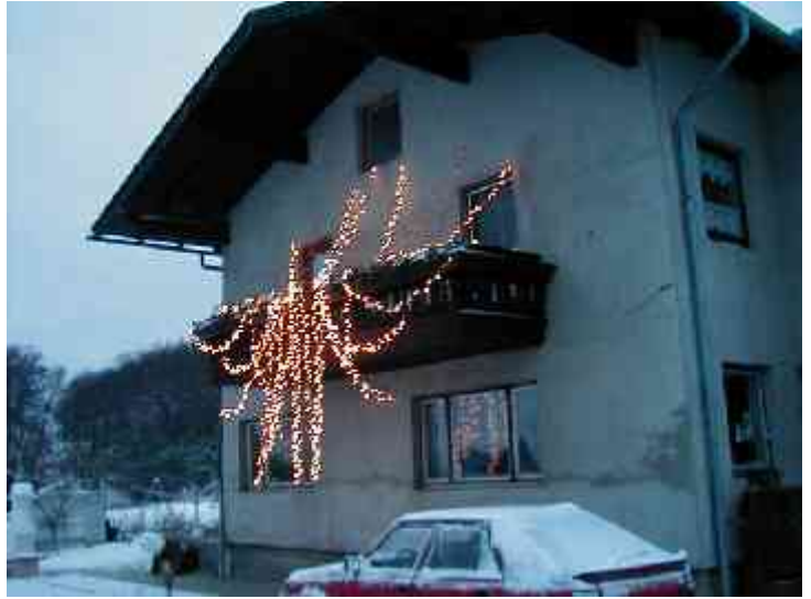
weihnachtlich geschmücktes Haus Ecker

Aber eines gibt es heute schon: Die Entstehungsgeschichte der neuen Kapelle von Heinz Steurer . Dieses Dokument ist auch für die Nachwelt in der Kapelle selbst an einer besonderen Stelle eingebaut.